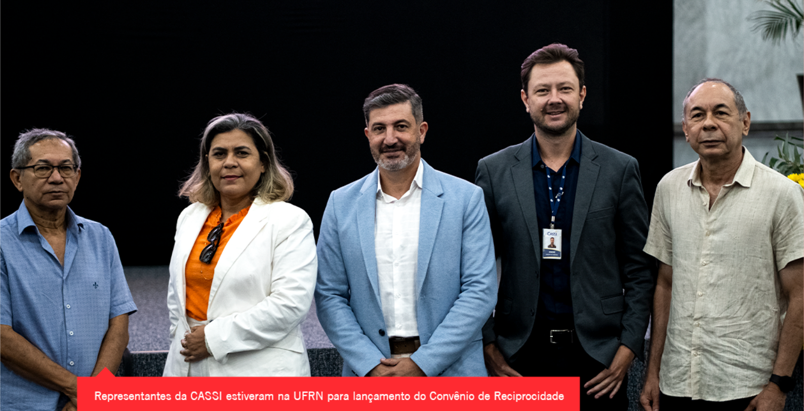
Representantes da CASSI estiveram na UFRN para lançamento do Convênio de Reciprocidade