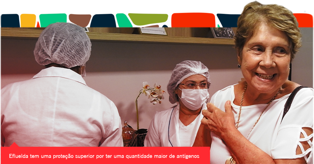
Efluelda tem uma proteção superior por ter uma quantidade maior de antígenos

Associados acima de 60 anos estão tendo a oportunidade de tomar a vacina que confere mais proteção contra a gripe